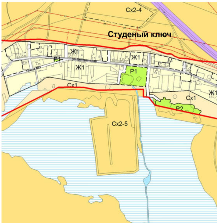
Карта планируемого размещения объектов местного значения д. Студеный Ключ муниципального района Сергиевский Самарской области (фрагмент)